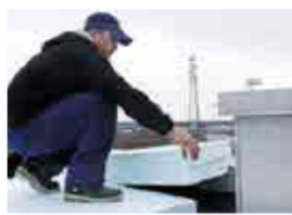
izolacja dachów płaskich