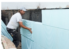
izolacja fundamentów, ścian piwnic, cokołów

Termoizolacja fundamentów, ścian piwnic, cokołów, dachów płaskich, podłóg i fasad w budownictwie mieszkalnym i przemysłowym oraz w obiektach użyteczności publicznej.